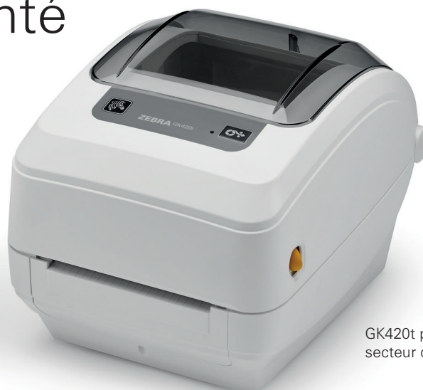
GK420t pour le secteur de la santé