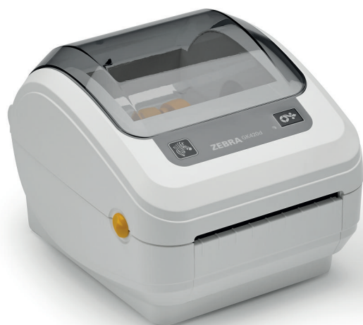
GK420d pour le secteur de la santé